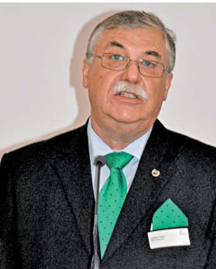
Links: Mittelstandsforum im voll besetzten Festsaal

Menschen in Baden-Württemberg waren im Monat Mai in der Zeitarbeitsbranche beschäftigt, 46 Prozent mehr als im Vorjahresmonat. Durch den starken Stellenzuwachs in der Zeitarbeitsbranche wurde der Beschäftigungsabbau in den übrigen Wirtschaftsbereichen (minus 15.000 Stellen) mehr als kompensiert. Nach wie vor besteht eine große Nachfrage nach Leiharbeitnehmern. Von 27.500 im Juli gemeldeten offenen Stellen entfielen 43 Prozent auf Zeitarbeiter.